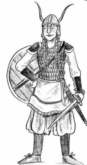
Walhallarama Hikkies moeder en dappere krijger