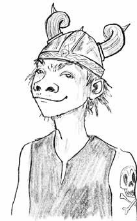
Snotsmoel Snotvlerk Overal goed in en een enorme pestkop