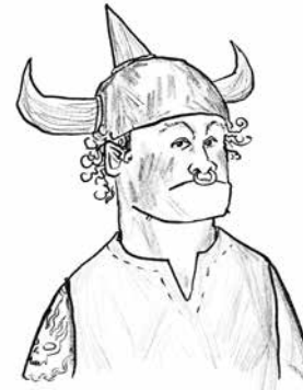
Meurmuil de Dumbo Snotvlerks vriend en mede-pestkop