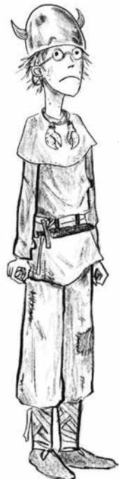
Hikkies beste vriend Vissenpoot