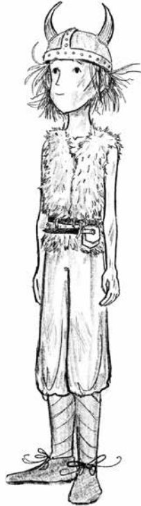
Hikkie , de held van dit verhaal