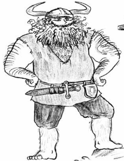
Stompus de Reus Hikkies vader en stamhoofd van de Vuige Vandalen (sterk, maar niet zo slim)