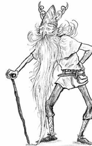
Ouwe Rimpel Hikkies grootvader, doet aan waarzeggen