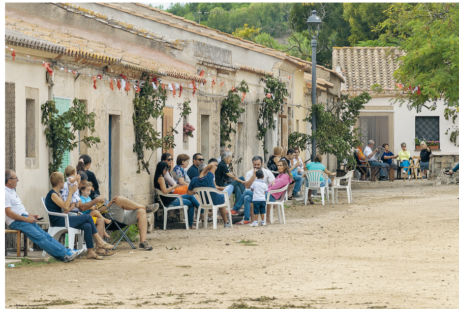
Op de grote dag van de 'curridoris' is iedereen erbij. In veel families wordt het dragen van het beeld van de Verlosser als een grote eer ervaren. Vaders geven deze taak vol overtuiging door aan hun zonen