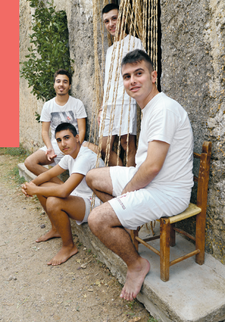
De loop duurt ongeveer een uur. Dan staat het beeld weer veilig in de kerk van San Salvatore en kunnen de lopers ontspannen